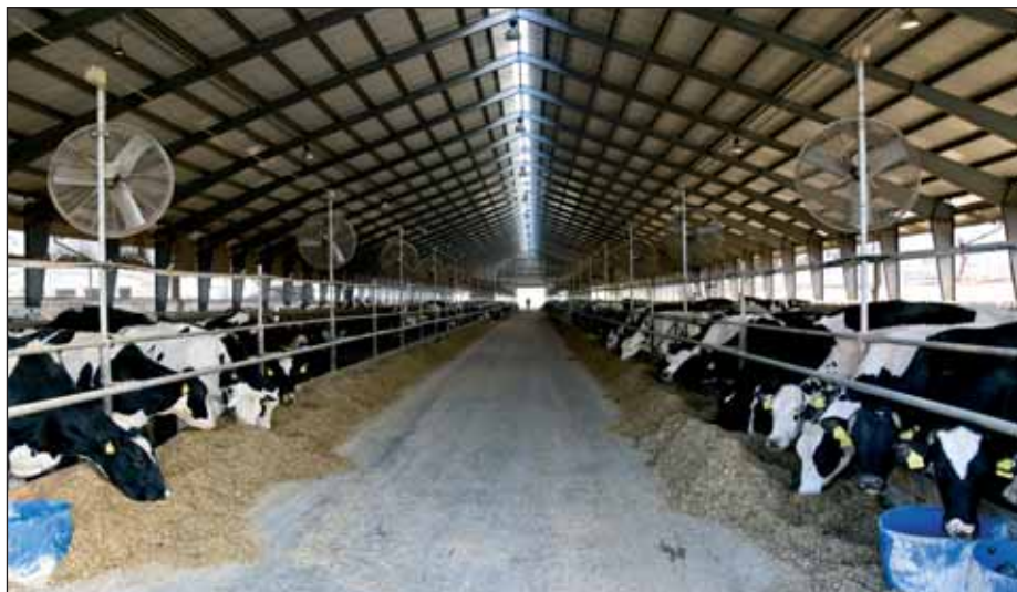
Všetky produkčné dojnice sú ustajnené v modernej maštali v tesnej blízkosti mliekarny.