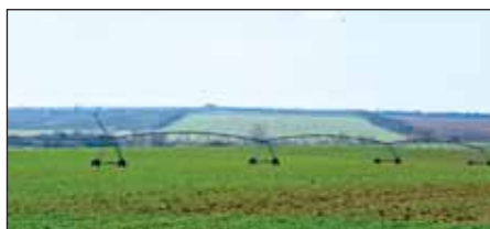
Dve úrody na jednej parcele. Porasty raže budú zberať začiatkom mája a následne tu zasejú sóju.