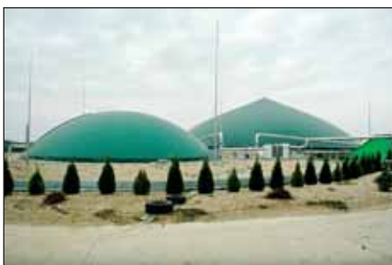
Bioplynová stanica ako efektívne premostenie medzi RV a ŽV.