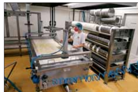
Miestna mliekareň so syrárnou dokáže v špičke spracovať denne až 20 tis. l mlieka.

Na záver nám nedá nespomenúť pár slov k efektívnemu systému predaja produktov Farmfoods, ku ktorým patria i výrobky z miestnej mliekarene. Skupina za ostatné roky posunula svoj predaj z prevažne pojazdnych predajní do